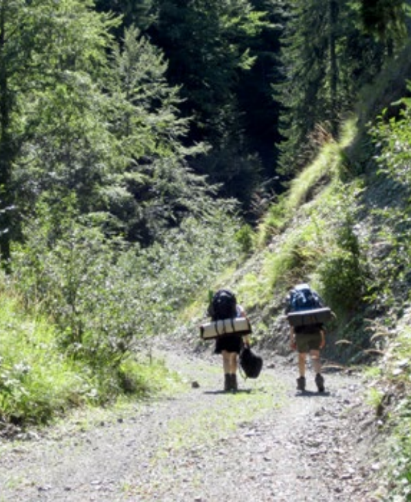
Abb. 1: Rucksack auf – und los!

ser an einer Haustür kann sich ein spannendes Gespräch oder eine große Hilfsbereitschaft entwickeln. Große Gruppen wirken da eventuell eher abschreckend.