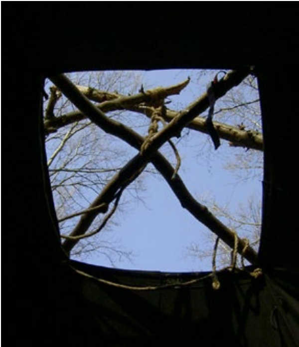
Abb. 7: Auf Fahrt – draußen aufwachen!