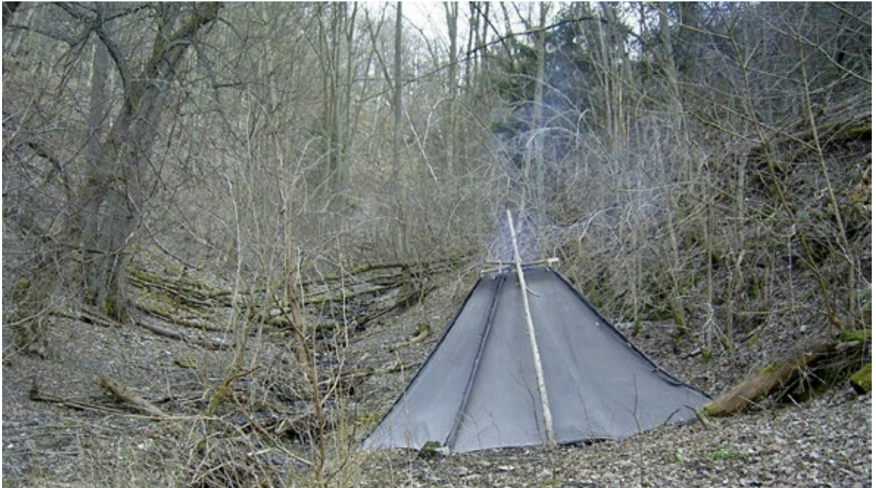
Abb. 5: Auf Fahrt – draußen schlafen!

oder einen Tag gar nichts machen. Solange am Ende der Zielpunkt entspannt erreicht wird und die Rückreise wie geplant stattfinden kann, ist es der Gruppe überlassen, wie sie ihre Tage gestaltet.