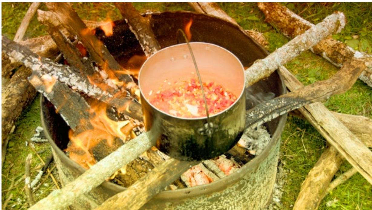
Abb. 6: Auf Fahrt – draußen kochen!