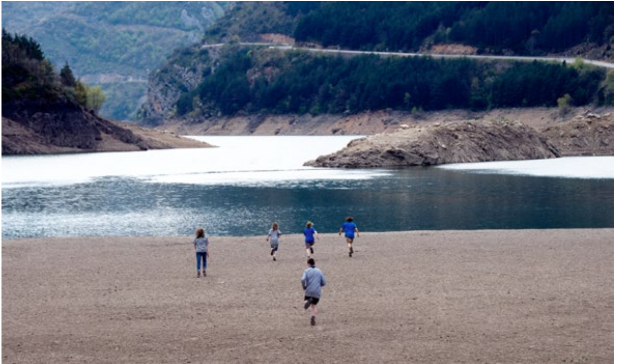
Abb. 4: Draußen wartet der Spaß!

Tagen reden, dürfte der Umfang überschaubar bleiben.