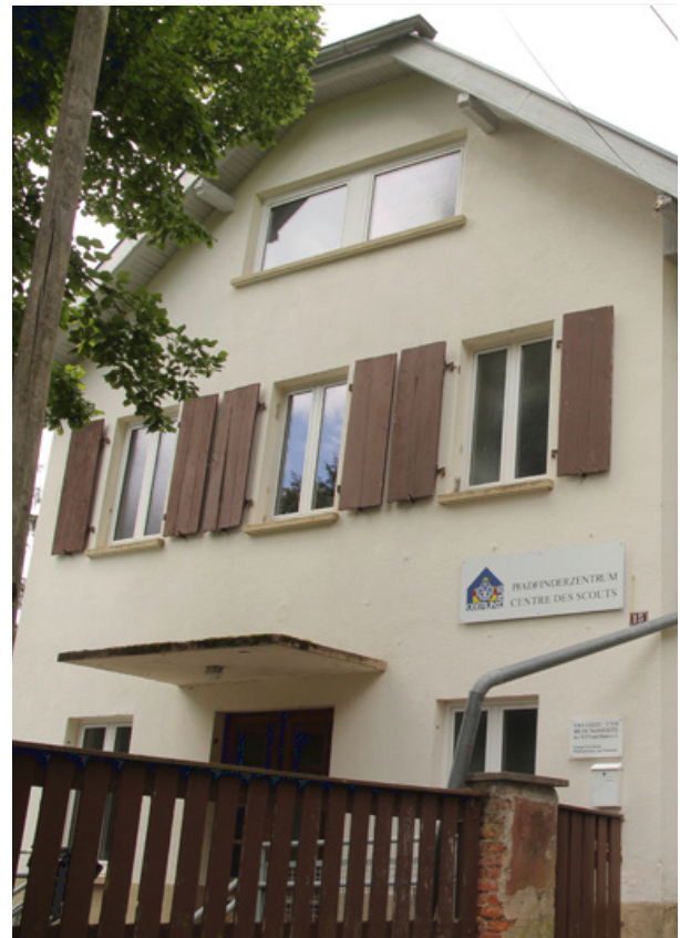
Abb. 1: Das Oberlin-Haus in La Vancelle