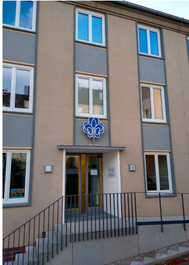
Abb. 7: VCP-Bundeszentrale