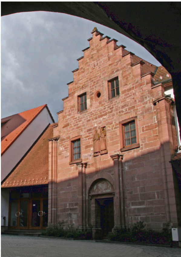
Abb. 3: Burg Rieneck

Schulungsorte: Burg Rieneck Schloßberg 1 97794 Rieneck