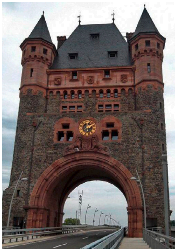
Abb. 6: Nibelungenturm Worms