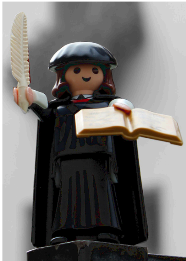
Abb. 4: Auch in Mitteldeutschland: Wittenberg