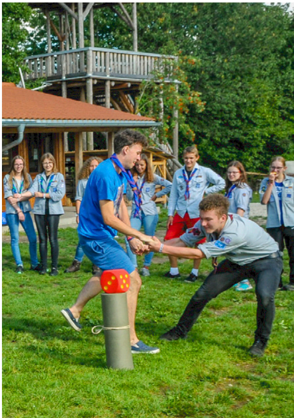
Abb. 2: BergLuFt auf dem Bucher Berg