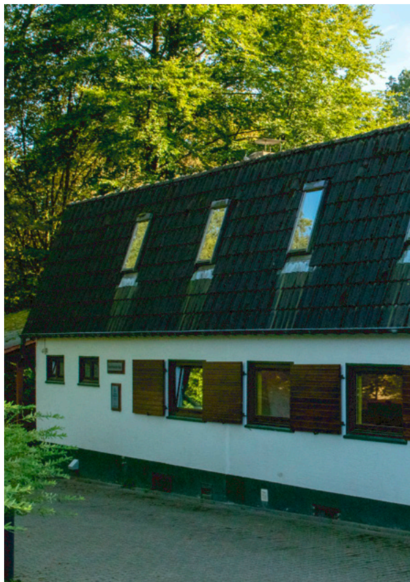
Abb. 5: Kurt-Hensche-Haus Osminghausen